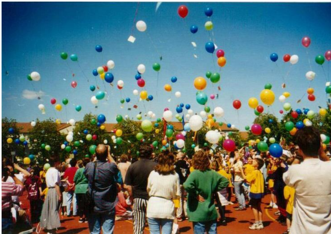
Namensgebung der Schule im Mai 1998

Unsere Schule ist ein Ort, an dem alle Beteiligten gern leben und arbeiten und Verantwortung übernehmen.